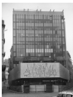
Esgrafiats del cos central amb l'edifici gairebé acabat