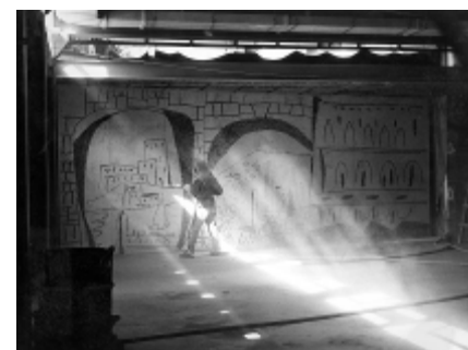
Carl Nesjar actuant sobre el fris intern dels arcs

Per a descarregar les imatges en alta resolució, feu clic sobre les mateixes.